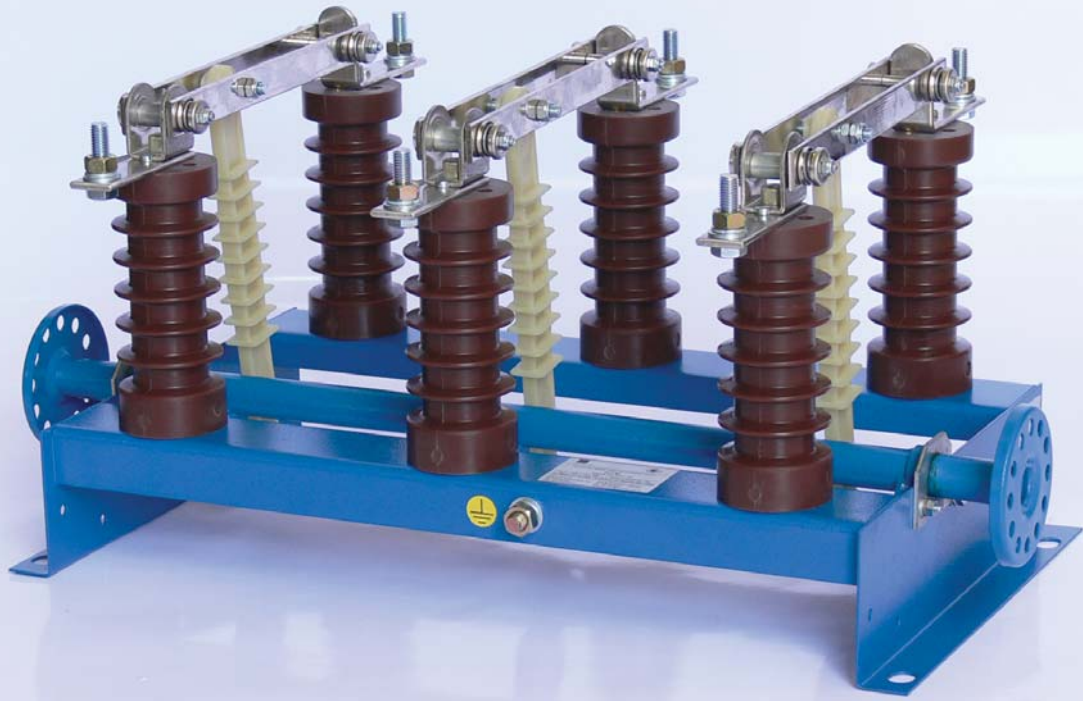
SECCIONADOR TRIPOLAR DE INTERIOR ICFD ICFM